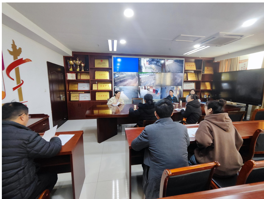
图 1 教体局现场访谈