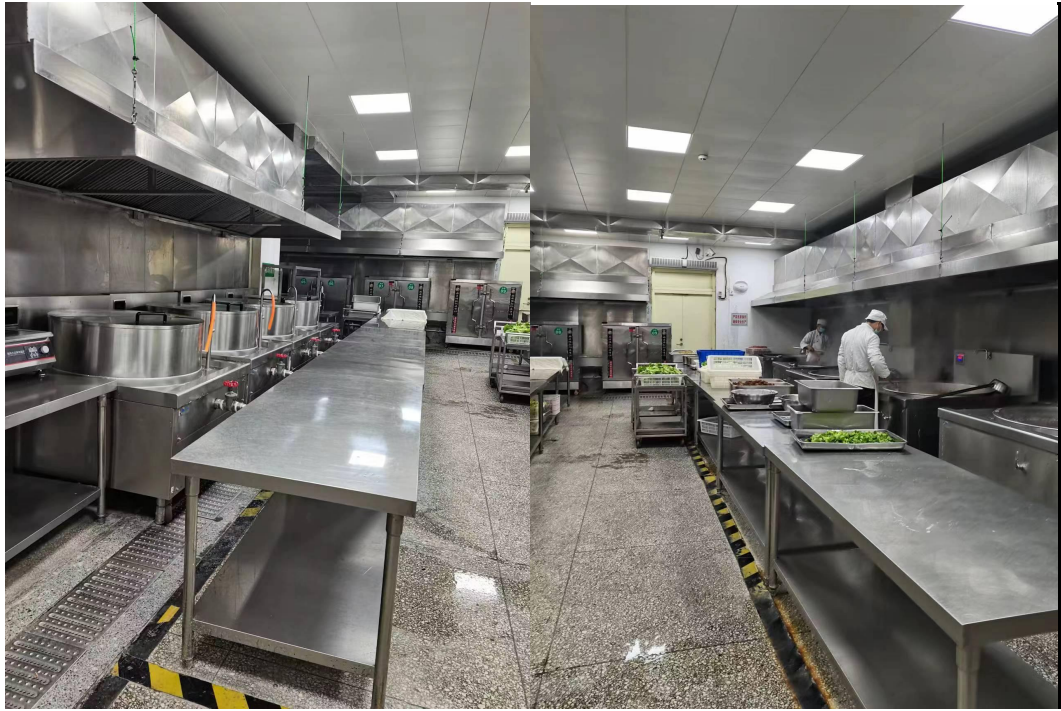
图 4 图 5 走访十八中食堂