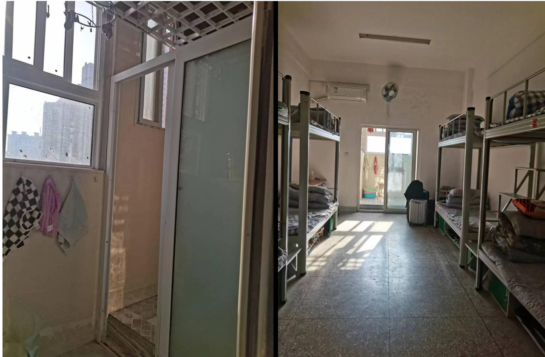
图 6 图 7 走访十八中宿舍