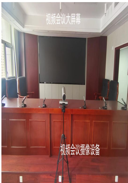
图 3：高清会议摄像机