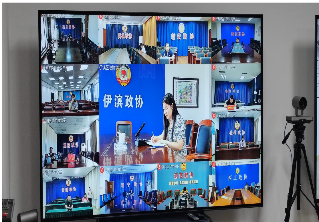
图 6： 高清会议摄像机、政协远程协商会议现场