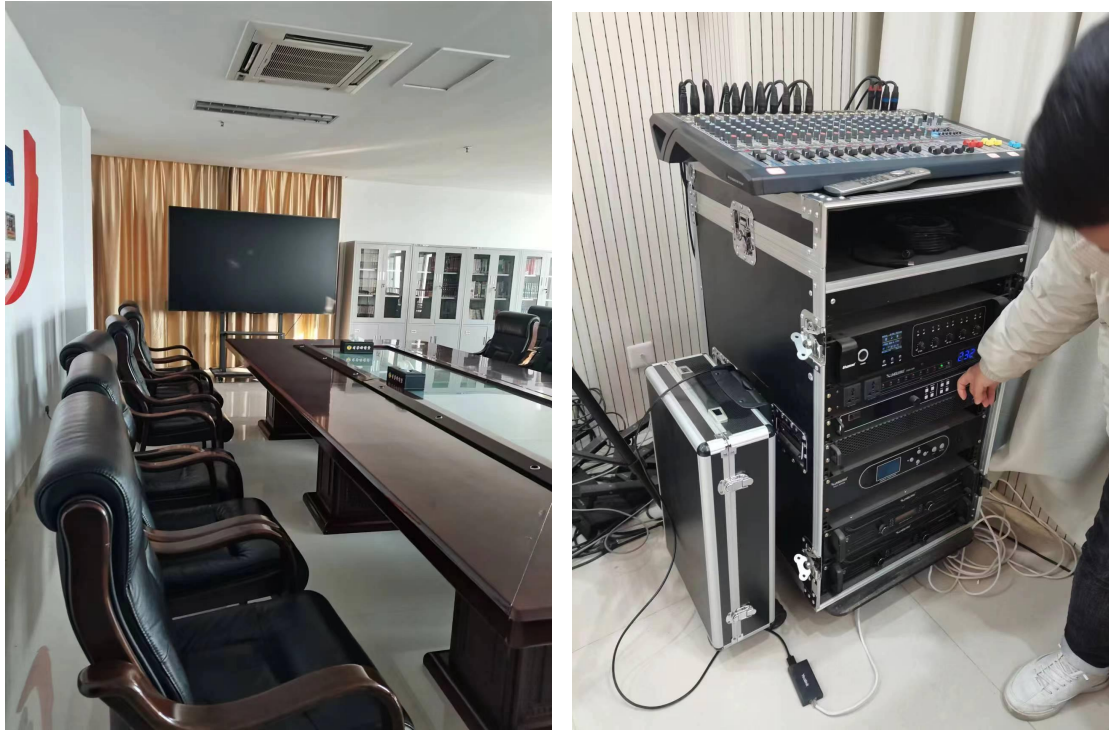
图 1：硬件设备：小米高清电视机、16 路编组调音台等