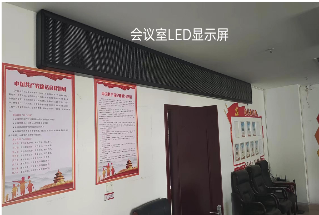
图 5：LED 显示屏